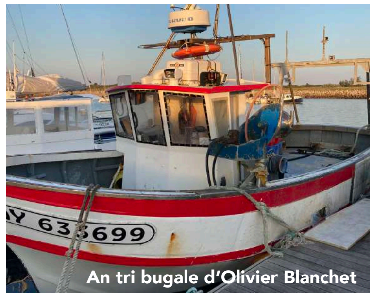
An tri bugale d'Olivier Blanchet