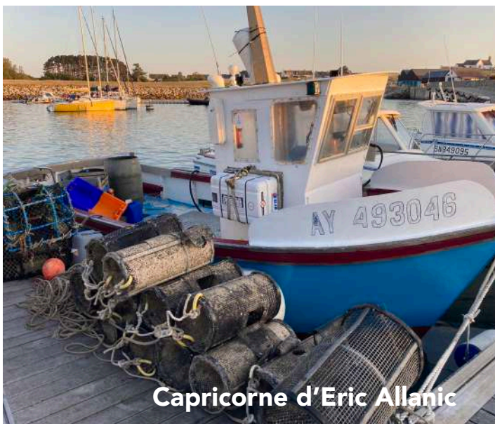
Capricorne d'Eric Allanic