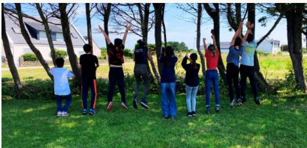
2023-2024 : 10 élèves de la 6è à la 3è (un absent sur la photo)