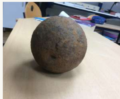
Notre boulet pèse 9,6 kg et mesure 44,5 cm de circonférence. Il est en fonte, et très rouillé.

On en trouve un peu partout, plutôt dans des régions où il y a pu avoir des combats. Effectivement, il y a eu des combats autour de Houat, Belle-île etc, à différentes époques, notamment au XVIII e siècle."