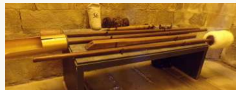
Les outils pour utiliser un canon.

Pour en savoir plus, écoutez le podcast sur le site du collègue :