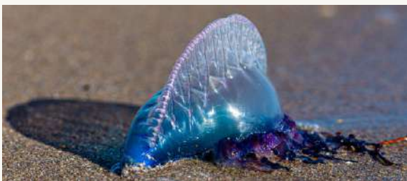
Une physalie

Seulement un organisme est mortel, mais il est rarement là : c'est la Physalie . En fait, ce n'est pas une méduse mais plusieurs individus accrochés à un flotteur. Elle a des teintes rosées ou bleutées avec du violet. Elle se démarque facilement : elle est reconnaissable avec le haut de son corps qui ressemble à un sac plastique rempli d'air. Celle-ci est extrêmement urticante, elle peut dans certains cas être mortelle. Elle a été vue trois fois en 2023 sur les plages de Houat.