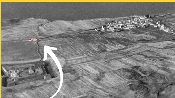
L'école publique de Houat à 220 m du bourg (IGN 1951)

L'école publique, était surnommée "l'école du diable".