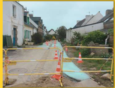
rue de Houat en avril 2024