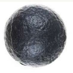
Le boulet restauré de l'Eclosarium. Il pèse 8,6Kg.